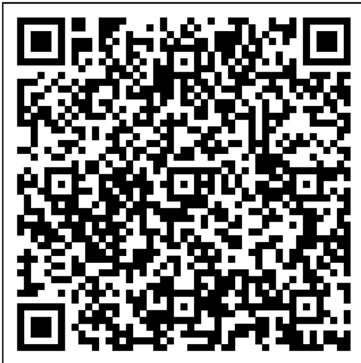
załącznik 1 - kod QR do quizu